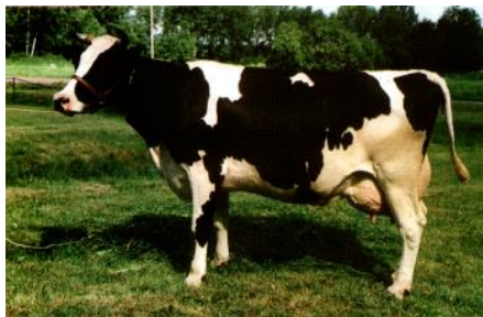
Рисунок 1 - Корова чёрно-пёстрой породы